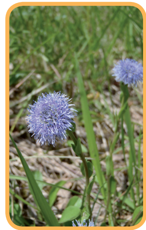
Jasione des montagnes

Tout ceci n'est qu'un aperçu de la biodiversité présente sur ces espaces tout au long de l'année. Natura 2000 offre, grâce à l'animation et les dispositifs mis en place, la possibilité pour tous de participer à leur préservation dans le respect de leur sensibilité.