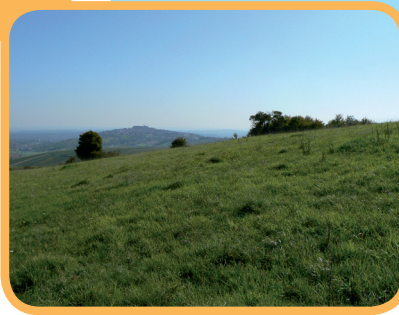
Vue sur Sancerre depuis les luneaux