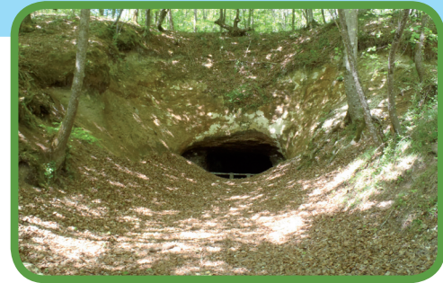
Entrée de grotte