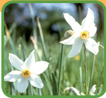
Narcisse des poètes

Les actions pourront être engagées par le contractant ou déléguées à un tiers dans le respect des cahiers des charges.